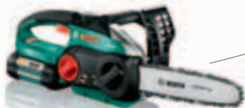
AKE 30 LI