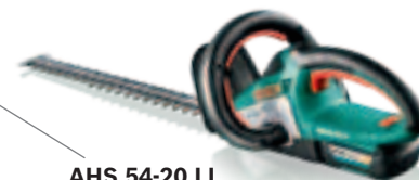
AHS 54-20 LI