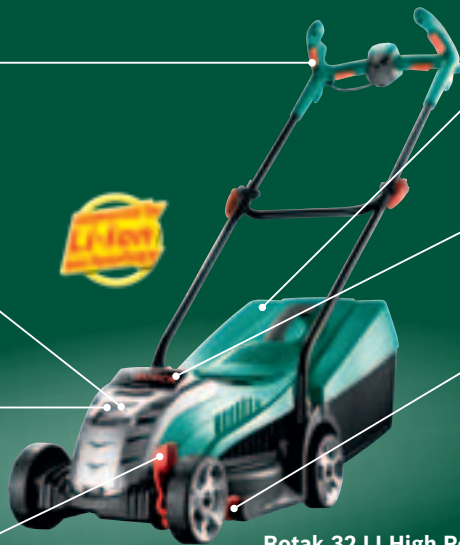
Rotak 32 LI High Power

ermöglicht eine rasche und einfache Einstellung der Grasschnitthöhe