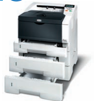
Abbildung mit Optionen.