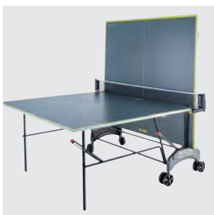
Alleintraining durch Play-Back-Stellung möglich (alle Tische)