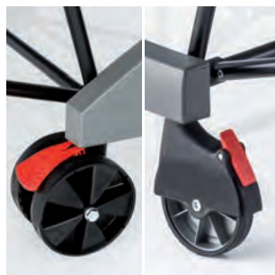
Doppelräder mit Sicherheitsbremse (OUTDOOR 3 + INDOOR 3) Räder mit Sicherheitsbremse (OUTDOOR 2 + INDOOR 2)