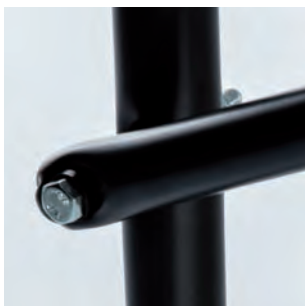
Untergestell aus schwarzem 25 mm Rundrohr (alle Tische)