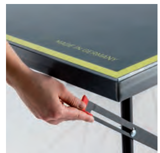
Leichte Ver- und Entriegelung des Gestells (alle Tische)