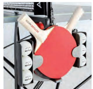
Ball- und Schlägerhalterung (OUTDOOR 3 + INDOOR 3)