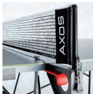
Netz mit Spannvorrichtung (alle Tische). Fest installiert (Abb.) bei OUTDOOR 3 + INDOOR 3