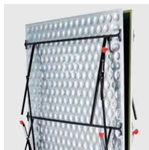
wetterfeste 22 mm ALU-Light-Verbundplatte (alle OUTDOOR-Tische)